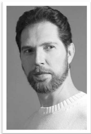
FELIPE BOU Bajo

Tras licenciarse en Derecho en 1990, perfecciona sus estudios de canto con Antonio Blancas y Alfredo Kraus. Es invitado en coliseos internacionales como el Théâtre du Capitole de Toulouse, Ópera de Roma, Ópera de Düsseldorf, Festival de Bregenz, Teatro Regio di Parma, Concertgebouw de Ámsterdam, Teatro Massimo di Palermo, Wiener Staatsoper, Santiago de Chile, Teatro del Maggio Musicale Fiorentino, así como otras ciudades y festivales en Génova, Piacenza, Fráncfort, Estrasburgo, Montpellier, Niza, Avignon, Lieja, St. Gallen u Orange.