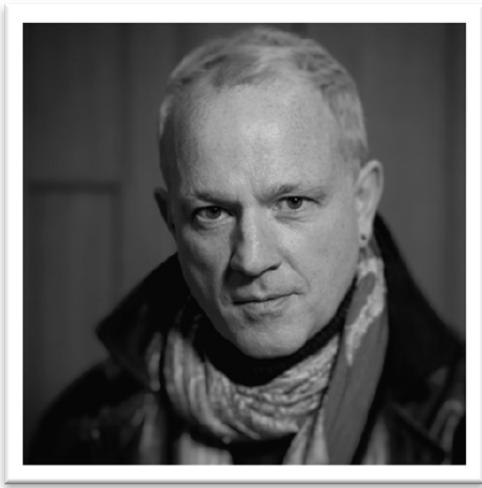
PETER WEDD* Tenor

Ha desarrollado una intensa carrera internacional en los mejores teatros: Royal Opera House, Covent Garden, Semperoper de Dresden, Bellas Artes de México, Philharmonie de Paris, English National Opera, Welsh National Opera, Glyndebourne, Ópera Nacional de Polonia, Opera North, Longborough, Garsington Opera, Opera Nacional de Grecia, Opera Australia, Leipzig, Karlsruhe, etc.